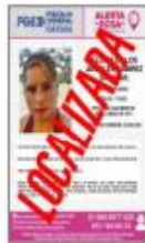
Eloina de los Ángeles Ramírez Salazar 45 años

Número de reporte: 21670/FNSC/CUICATLAN/2022 Última fecha vista: 16/06/2022 Fecha de conclusión: 23/06/2022