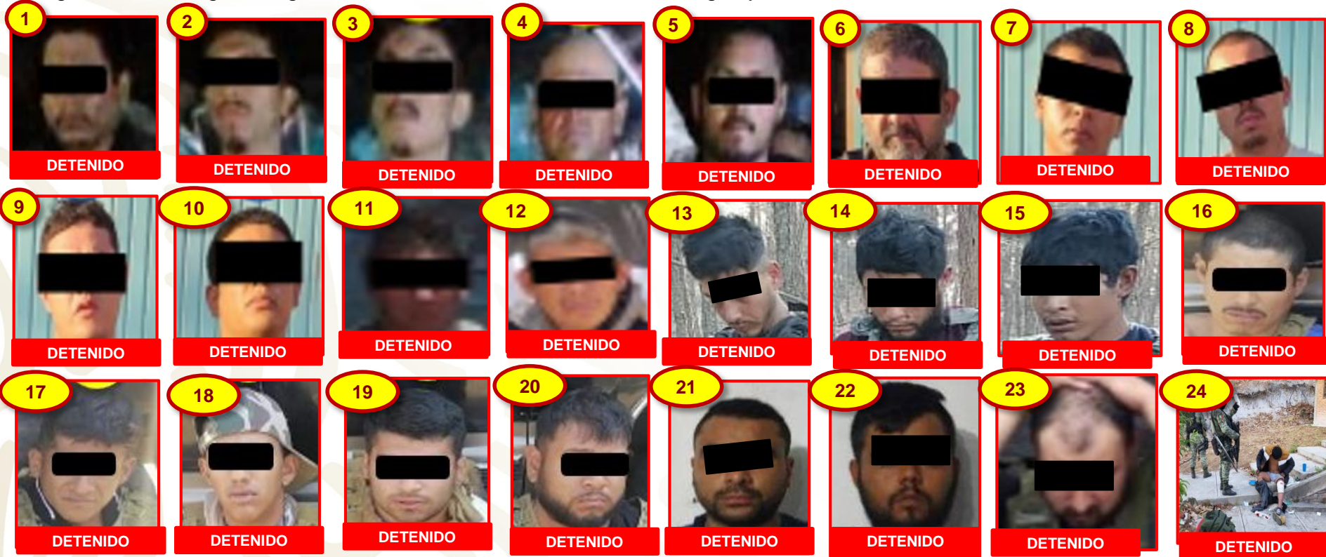
Imágenes de detenidos relevantes

Desde el mes de Abril al 25 de Junio de 2022 personal de la SEDENA y de la GN han logrado la detención de 24 generadores de violencia en las en las regiones de Manzanilla de la Paz, Santa María del Oro y San José de Gracia , se les han logrado asegurar armas largas, cargadores, cartuchos, chalecos tácticos, drogas y vehículos.