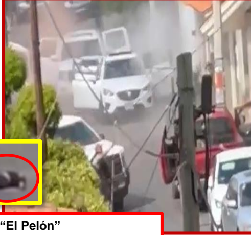
Cuerpo del "El Pelón"