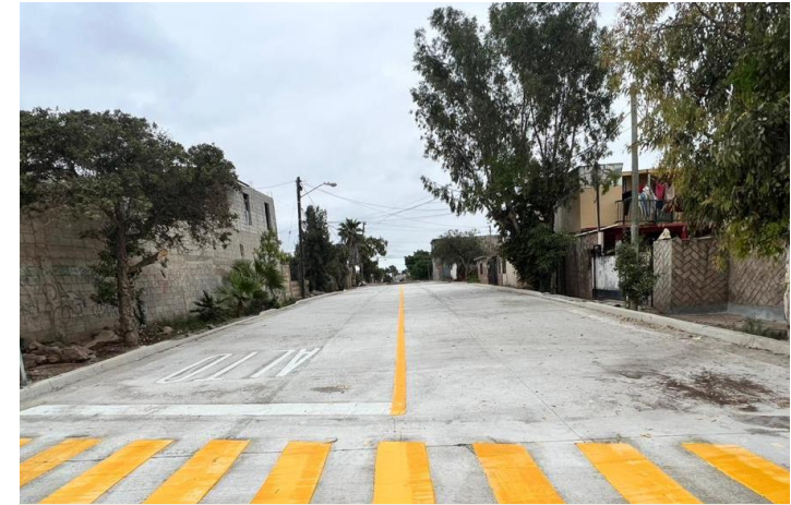
Baja California Sur