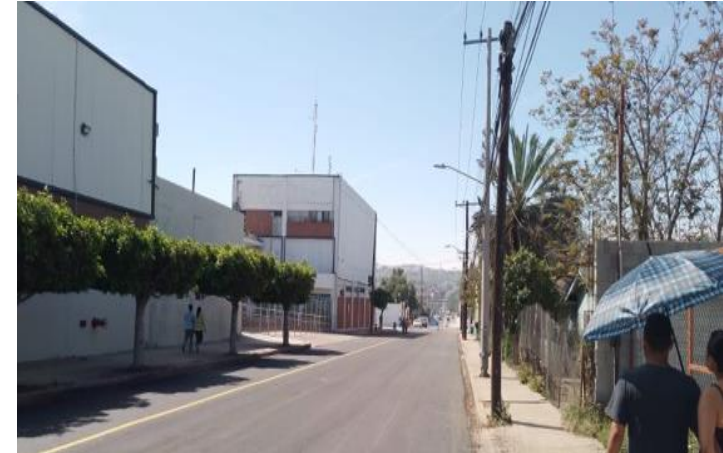
Baja California Sur