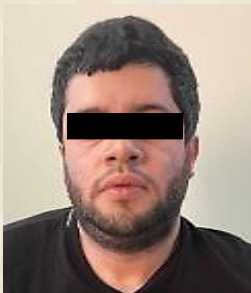
Néstor Isidro "N" (a) "El Nini"

Néstor Isidro "N" , presunto jefe de sicarios del CDS y jefe de seguridad de la facción "Los Chapitos", fue detenido con fines de extradición el 22 Nov 2023 tras un operativo implementado por elementos del Ejército Mexicano y Guardia Nacional en el municipio de Culiacán, Sinaloa .