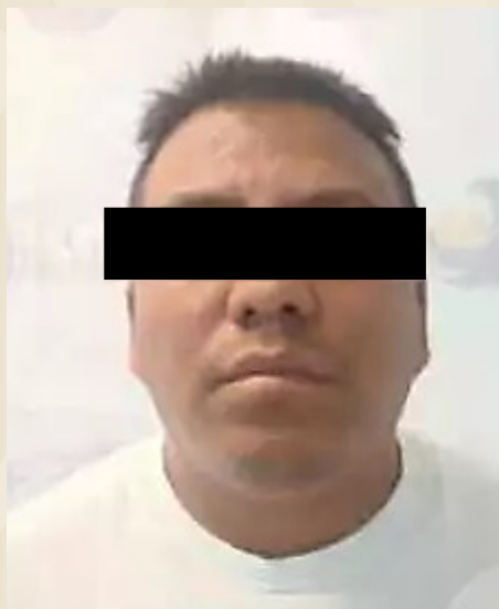
Francisco Javier "N"