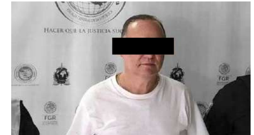
César Horacio "N" Ex Gobernador de Chihuahua Detenido con fines de extradición el 8 Jul 2020 en Miami, Estados Unidos , acusado por peculado y asociación delictuosa , ambos con penalidad agravada.

Fue hasta el 6 Jun 2024 que la misma jueza, tras convocar a una audiencia de revisión de medidas , cambió la prisión preventiva a prisión domiciliaria, portación de brazaletes electrónicos y entrega de pasaporte, entre otras.