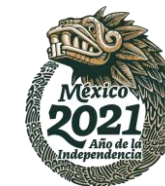
RELACIÓN DE CONTRATOS